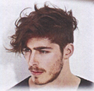
写真はあくまでイメージです